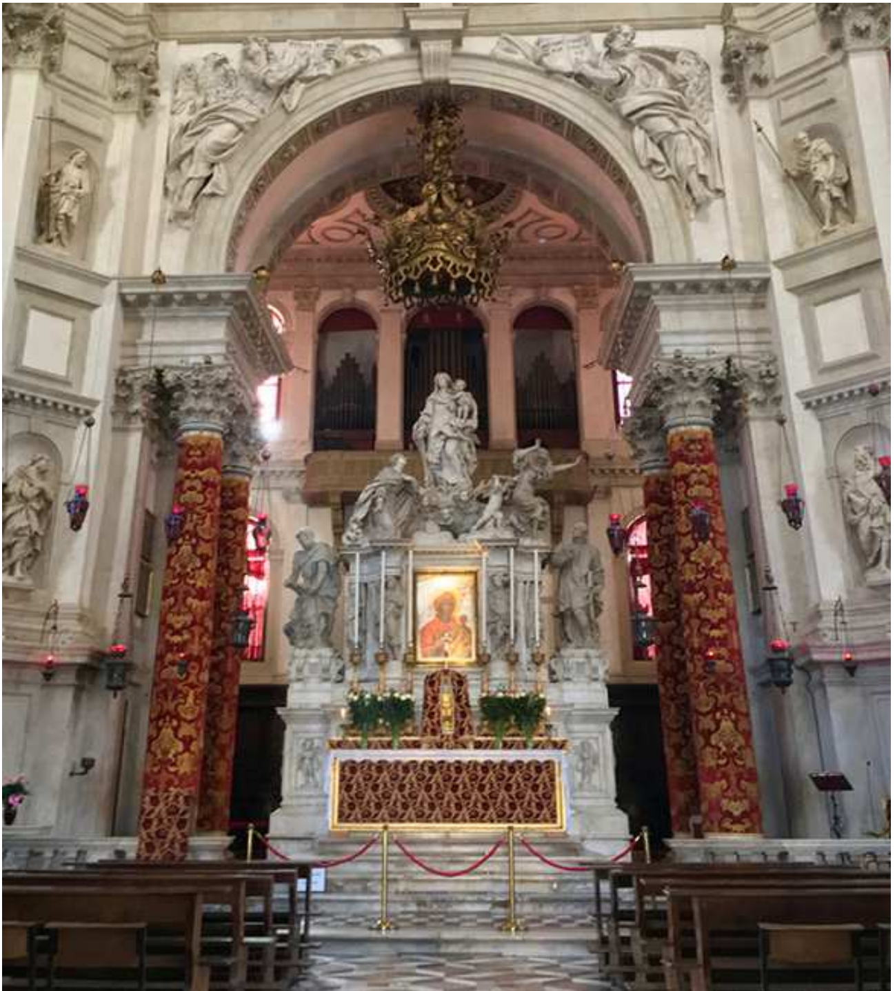
Venezia, Basilica di Santa Maria della Salute, altare maggiore sovrastato dall'organo di Francesco Dacci (1783)