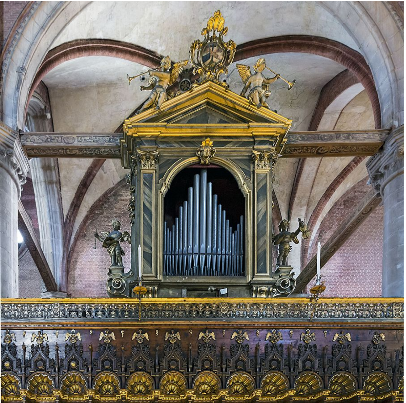
Venezia, Basilica di Santa Maria Gloriosa dei Frari, organo di Gaetano Callido (1796)